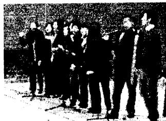
「J's choir」ゴスペルの歌声が ホールに響きわたりました！