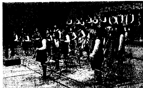
すばらしい演奏をしてくれました 吉成小学校「サウンドアソシアル」の 皆さんです♪