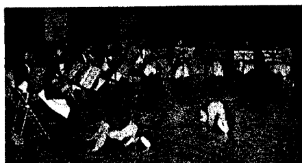
ママプラス「ぴよぴよ隊」の リハーサルは子供達と一緒に・・・