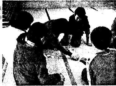
坊主めくりも楽しいね。