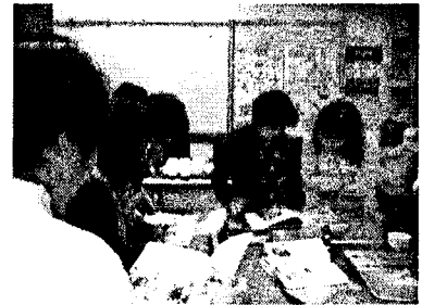
フランス語っておもしろい!