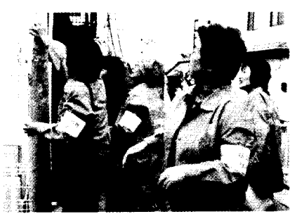
違法張り紙の撤去

北地区防連は大会時管内の小学生を一日警察署長に委嘱し、キャンペーンを行いました。