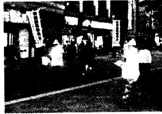
街頭キャンペーン

十月十一日(水)仙台駅東口において、街頭キャンペーンを実施し、被害防止を訴えました。