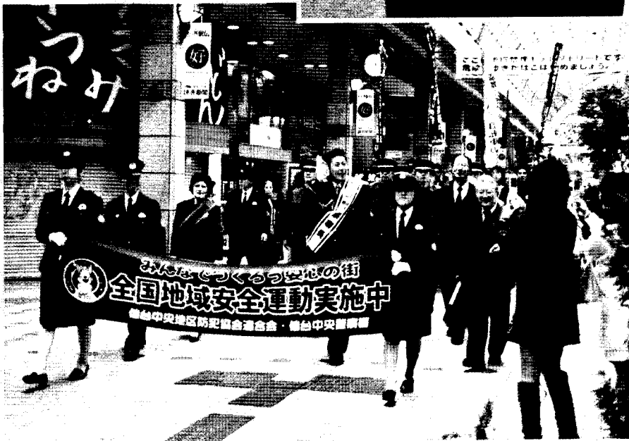
街頭キャンペーン