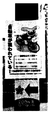
会場に掲示した自転車盗難防止ポスター

仙台駅周辺で多発する自転車盗に歯止めをかけるためグッズを配り、防犯登録等のキャンペーンを行いました。