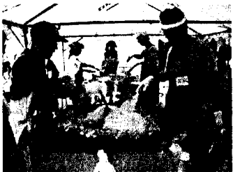
焼きそばは任せてとお父さん方

また、PTAバザーにも多くの保護者の皆さんの参加があり、おいしい焼きそばや豚汁を作っていました。ありがとうございました。今回は、学校全体で「スクールエコプラン」というテーマで取り組んでいることもあり、ワケルモービルも登場しました。