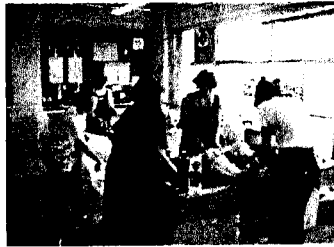
豚汁の下ごしらえも大変なんです