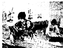
3年「生け花」と「琴演奏」

来年も調べ学習を頑張り、発表の仕方をもっとうまくできるよう頑張りたいと思います。そして、今の3年生を超えられるようになりたいと思います。