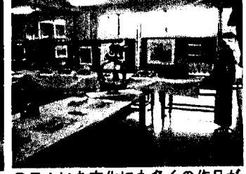
PTAいち文化にも多くの作品が