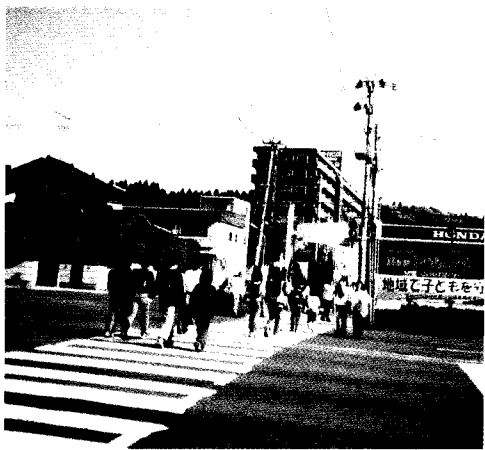
荒巻地区でのキャンペーン状況

仙台北地区小松島防犯協会では、警察署等の応援を得て、期間中地区内において *街頭キャンペーンを実施し、各種事故防止に努めました。