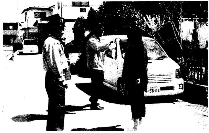
盗難防止の指導状況

仙台南地区東中田防犯協会では、運動期間中の四月二十三日(日)全町内に対する防犯診断を実施し、「車上ねらい」「乗り物窃盗」などの街頭犯罪、「空き巣ねらい」などの侵入犯罪の抑止を目的に、地区住民に盗難の意識付けを行いました。